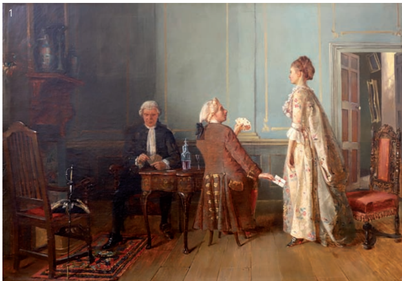
1 Edgard PORTEUS (XIX ème siècle) 1873. Huile sur toile signée en bas à gauche 60 x 85 cm. Estimation : 1 500 à 2 000 euros.