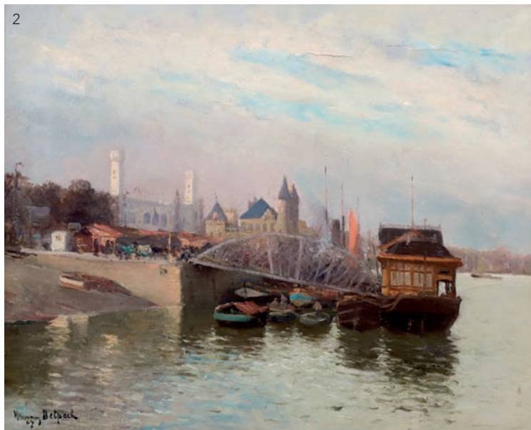
2 Hermann DELPECH (né en 1865) Huile sur toile signée en bas à gauche et datée 1907. 61 x 73 cm Estimation : 800 à 1 000 euros