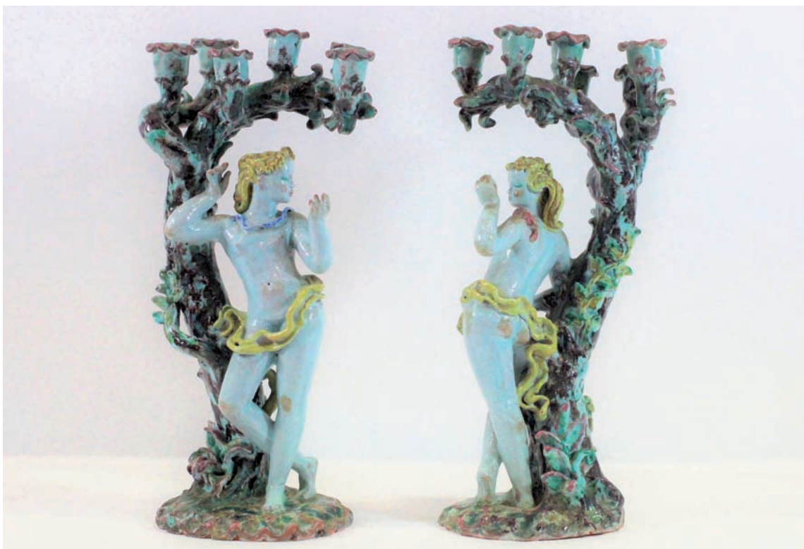
René BUTHAUD (1886-1986) Paire de flambeaux "Naïades" en faïence à couverte polychrome. Chaque fût porte cinq binets végétalisés en fleurons. Monogrammés en noir à l'arrière des fûts. Hauteur : 52,5 cm. Estimation : 5 000 à 6 000 euros